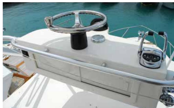
Posto guida sul tuna tower