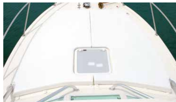
Prendisole a prua

Confortevole il locale toilette separato, rifinito con piano in Corian, lavello con rubinetto estraibile ed impiegabile quale doccia, wc marino e mobiletti vari, oltre a faretti ed oblò.