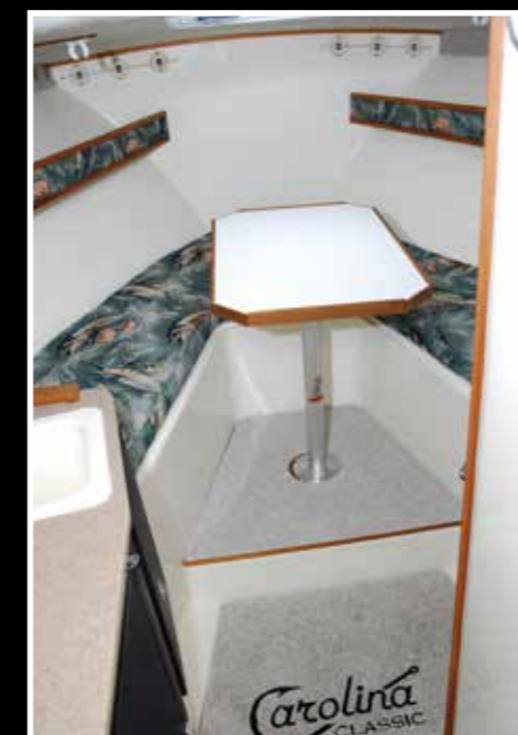
Dinette con tavolo smontabile