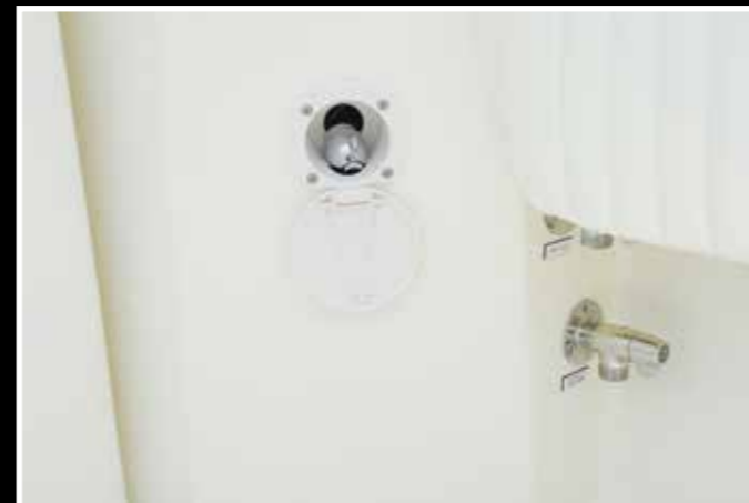
Doccia e presa d'acqua