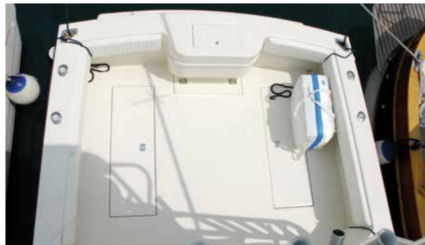
Il pozzetto è ampio e comodo per svolgere l'azione di pesca

soprattutto in caso di grosse prede da dover imbarcare. Stessa cosa dicasi per la piattaforma di poppa dotata di scaletta a scomparsa, anch'essa di recente oggetto di rivisitazione tecnica al fine di renderla più ampia ed optional. L'area prodiera accoglie gli apparati per l'ormeggio e l'ancoraggio, e non è prevista la presenza di un prendisole sulla tuga, anche se volendo c'è comunque spazio per predisporlo e adottarlo. L'area di pilotaggio è coperta da un hard top, a sua volta opzionalmente sommontabile da un tuna tower, sul quale prendono posto i doppi comandi di pilotaggio ed un divano. La struttura prevede anche, posteriormente al livello dell'hard top, dei portacanne supplementari che, con eventuali divergenti, possono garantire un buon numero di canne in pesca contemporaneamente.