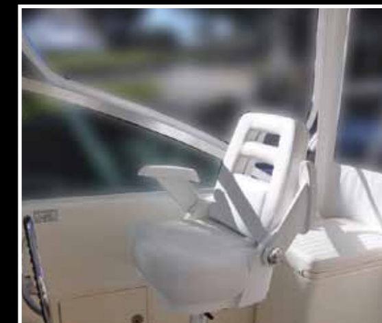
Poltroncina del guidatore