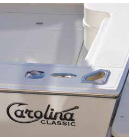
Bitte sui bordi

L'AREA DI pilotaggio dispone sul lato sinistro di un mobile a cassetti ove riporre accessori quali ami, montature ed artificiali, che nella parte interna diventa la parete del divano bi-posto per i passeggeri, a sua volta integrabile con una vasca refrigerata amovibile, anch'essa dotata di cuscini e quindi utilizzabile come seduta.