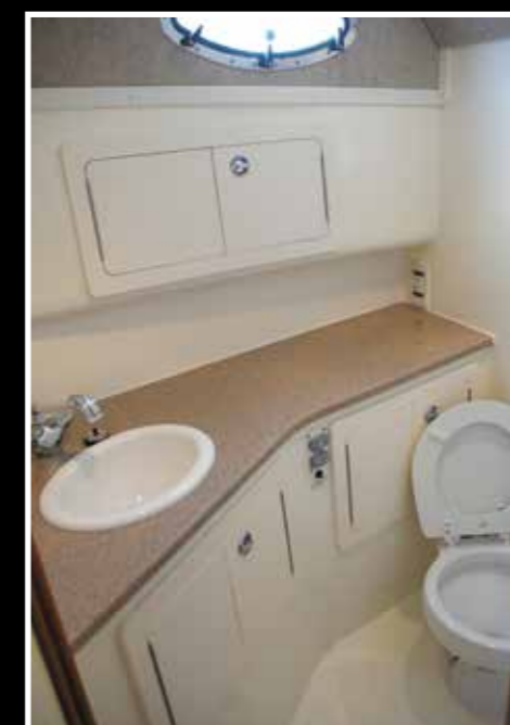
Toilette in locale separato