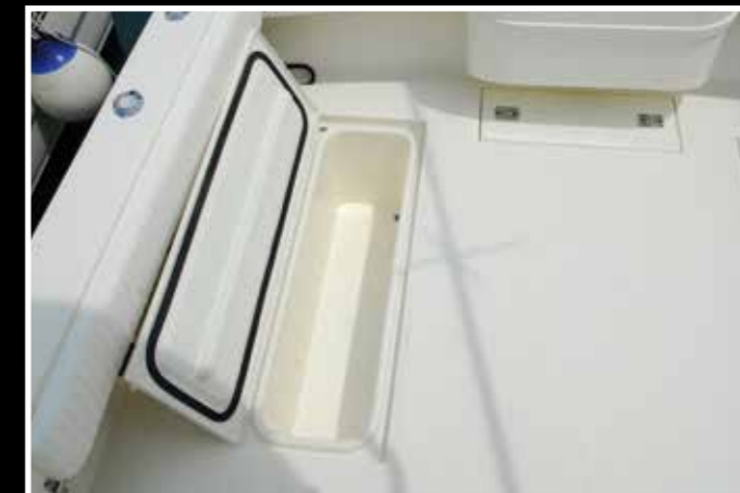
Vasca per il pescato con scarico fuori bordo