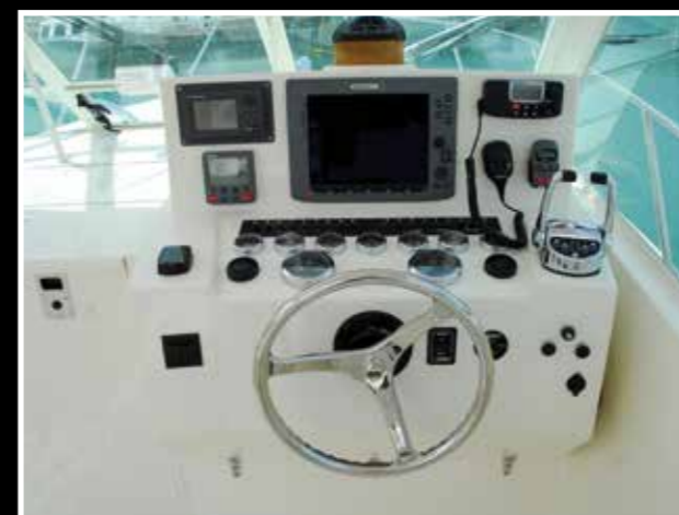
Cruscotto e strumentazione