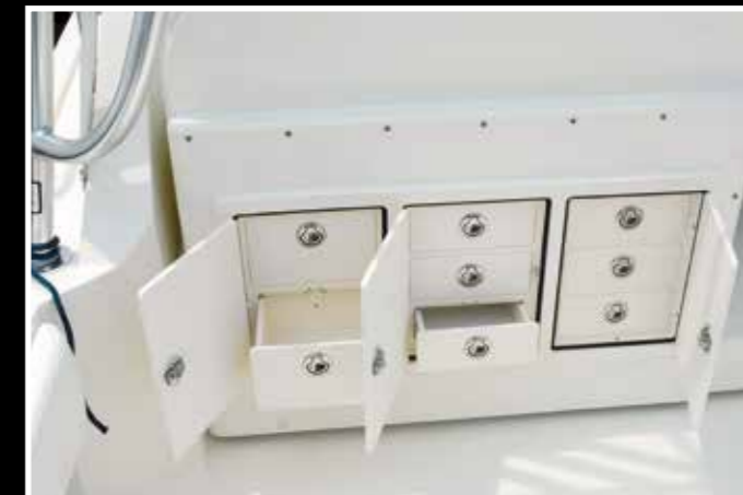
Mobile a cassetti porta attrezzatura