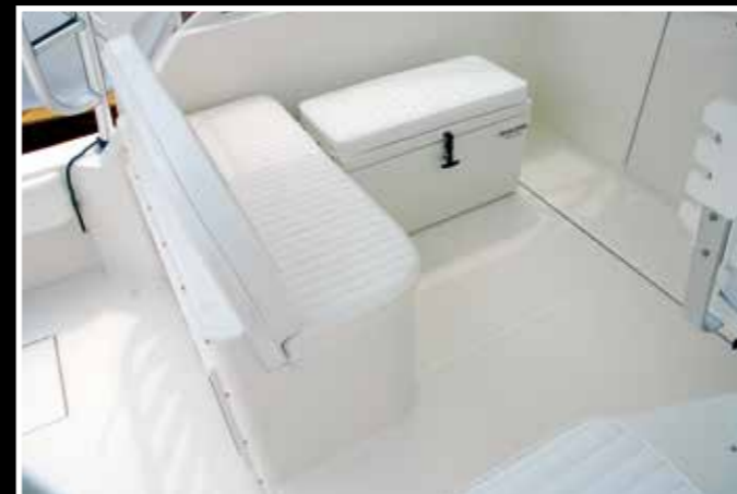
Divano e ghiacciaia