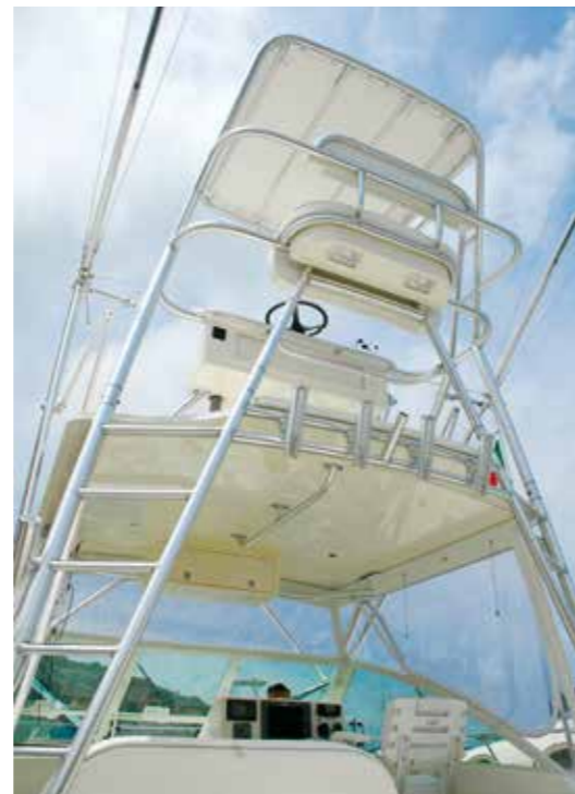
L'imponente e scenografico tuna tower

soprattutto in caso di grosse prede da dover imbarcare. Stessa cosa dicasi per la piattaforma di poppa dotata di scaletta a scomparsa, anch'essa di recente oggetto di rivisitazione tecnica al fine di renderla più ampia ed optional. L'area prodiera accoglie gli apparati per l'ormeggio e l'ancoraggio, e non è prevista la presenza di un prendisole sulla tuga, anche se volendo c'è comunque spazio per predisporlo e adottarlo. L'area di pilotaggio è coperta da un hard top, a sua volta opzionalmente sommontabile da un tuna tower, sul quale prendono posto i doppi comandi di pilotaggio ed un divano. La struttura prevede anche, posteriormente al livello dell'hard top, dei portacanne supplementari che, con eventuali divergenti, possono garantire un buon numero di canne in pesca contemporaneamente.